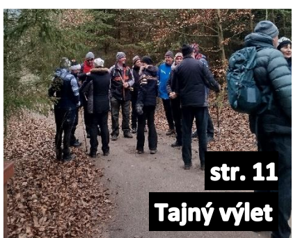
str. 11 Tajný výlet