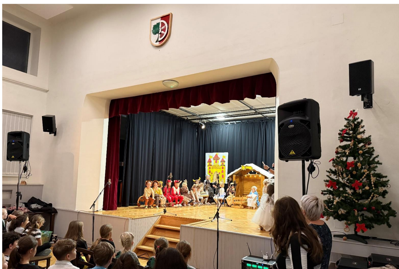
Vánoční besídka ZŠ Pohorří a MŠ Pohorří více informací na straně 6, 7 a 18