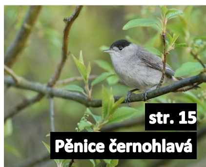
str. 15 Pěnice černohlavá