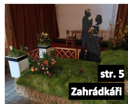
str. 5 Zahrádkáři