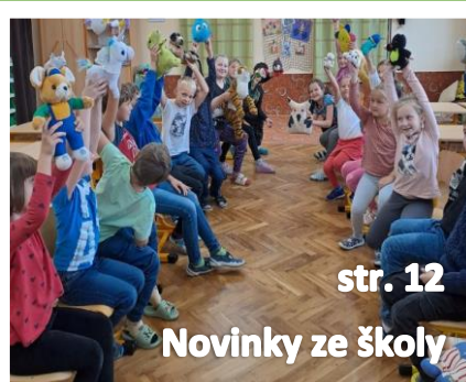
str. 12 Novinky ze školy