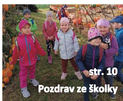
str. 10 Pozdrav ze školky