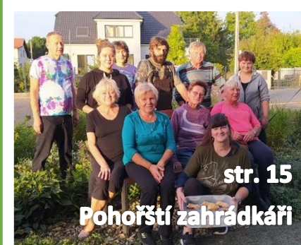
str. 15 Pohořští zahrádkáři